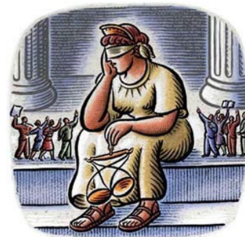
Ma la giustizia è uguale per tutti?

luogo alla sanzione massima dell'espulsione dal lavoro. La guardia giurata, rivolgendosi in Cassazione aveva lamentato la severità della sanzione per quello che sosteneva essere stato un semplice "colpo di sonno" dovuto anche al fatto che per il suo lavoro doveva restare fermo in macchina per otto ore e al freddo. La Cassazione nel respingere il ricorso ha spiegato che i due episodi contestati sono particolarmente gravi perché il lavoratore è stato rinvenuto non semplicemente assopito ma profondamente addormentato.