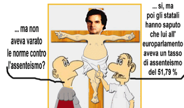
(ANSA) - TRIESTE, 12 GIU. - Renato Brunetta, che ha annunciato battaglia contro i fannulloni nella P.A., è stato tra gli europarlamentari italiani più assenteisti. Lo sottolinea il Piccolo di Trieste, che cita il sito web radicale 'Fai notizia', secondo cui il ministro si piazza al 611° posto come presenze tra gli europarlamentari, con un percentuale del 48,21%.

“devastante” del Governo che se applicata in comparti deboli potrebbe comportare uno smantellamento degli stessi contratti collettivi recentemente sottoscritti. Quindi la campagna contro i dipendenti pubblici oltre a fare tanta immagine, funge da cortina fumogena a tutta la parte normativa sul lavoro privato. È per questo che bisogna coinvolgere tutti i lavoratori pubblici e privati contro questo decreto.