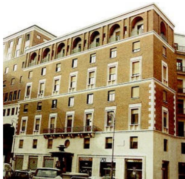
Il Tar del Lazio