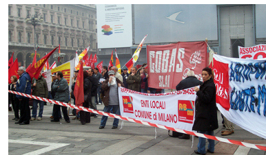
Manifestazione contro la finanziaria 2006

Si accresce la discrezionalità del datore di lavoro pubblico. Con trentacinque anni di contributi si potrà essere esonerati dal servizio con il 50% dello stipendio, ma nello stesso periodo si potranno svolgere "legalmente" altri lavori. Una sanatoria per i doppio-lavoristi, senza alcun beneficio aggiuntivo in termini di nuova occupazione. Da un lato il governo si propone di allungare per via volontaria la permanenza in servizio ma, dall'altro, incentiva l'esodo anticipato. Il possibile esonero vale anche per chi raggiunge i quarant'anni di anzianità. Tanta discrezionalità senza criteri apre le porte ad una nuova stagione di spoils system così come le norme sulle Agenzie fiscali.