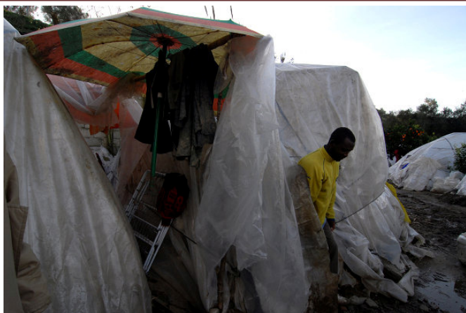
Rosarno: un accampamento fra gli agrumeti

Se voi avete diritto di dividere il mondo in italiani e stranieri allora io reclamo il diritto di dividere il mondo in diseredati e oppressi da un lato, privilegiati e oppressori dall'altro. Gli uni sono la mia patria, gli altri i miei stranieri.