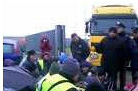
Brembio — le fasi del picchetto

Borruso, hanno incrociato le braccia ed effettuato un picchetto continuato davanti l'azienda per ben 82 ore di fila. Lo sciopero causato dal cambio di appalto con conseguente tentativo di ridimensionare i diritti dei lavoratori, è stato iniziato da 35 lavoratori. Nella serata della prima giornata di sciopero la polizia caricava i lavoratori arrestando un rappresentante sindacale ed un lavoratore. La solidarietà attiva di altri lavoratori ed organizzazioni ha permesso agli scioperanti di non farsi intimidire, così il picchetto è proseguito fino alla vittoria finale.