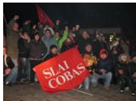
Brembio — i festeggiamenti per la vittoria conseguita